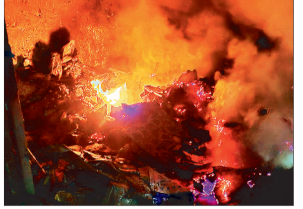
रिंग रोड टू गौरव पथ स्थित कबाड़ी की दुकान में लगी आग।