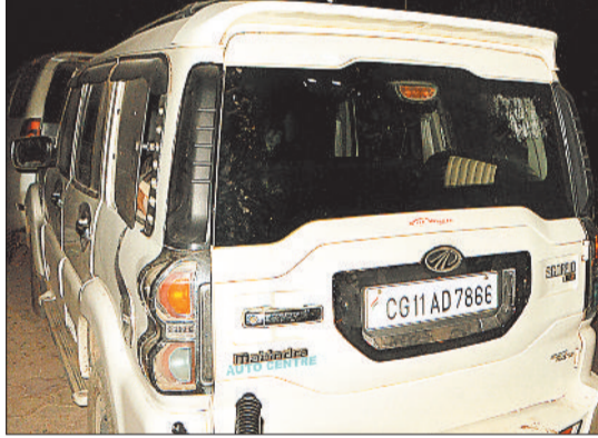
आरोपी से जब्त स्कार्पियो।