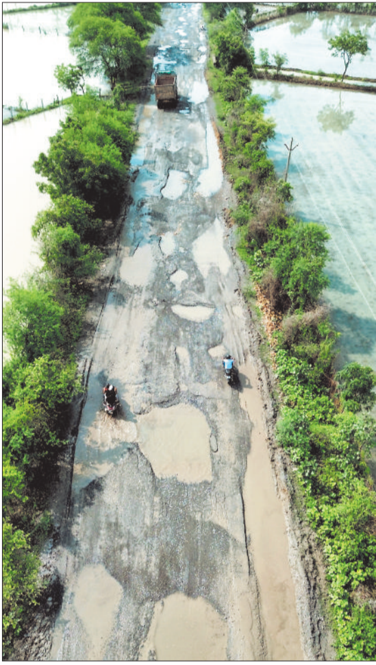
कोनी-मोपका की खराब सड़क का होगा जीर्णोद्धार।